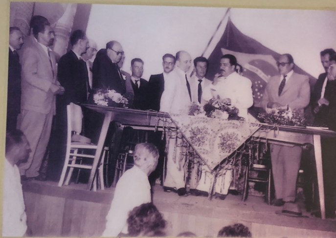
Instalação da 1ª Câmara de Vereadores de Gramado. Dia 28 de fevereiro de 1955, no Cine Splendid.